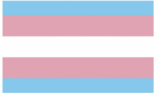
Flagge für transgeschlechtliche Menschen