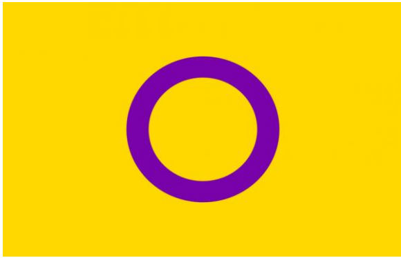
Flagge für intergeschlechtliche Menschen